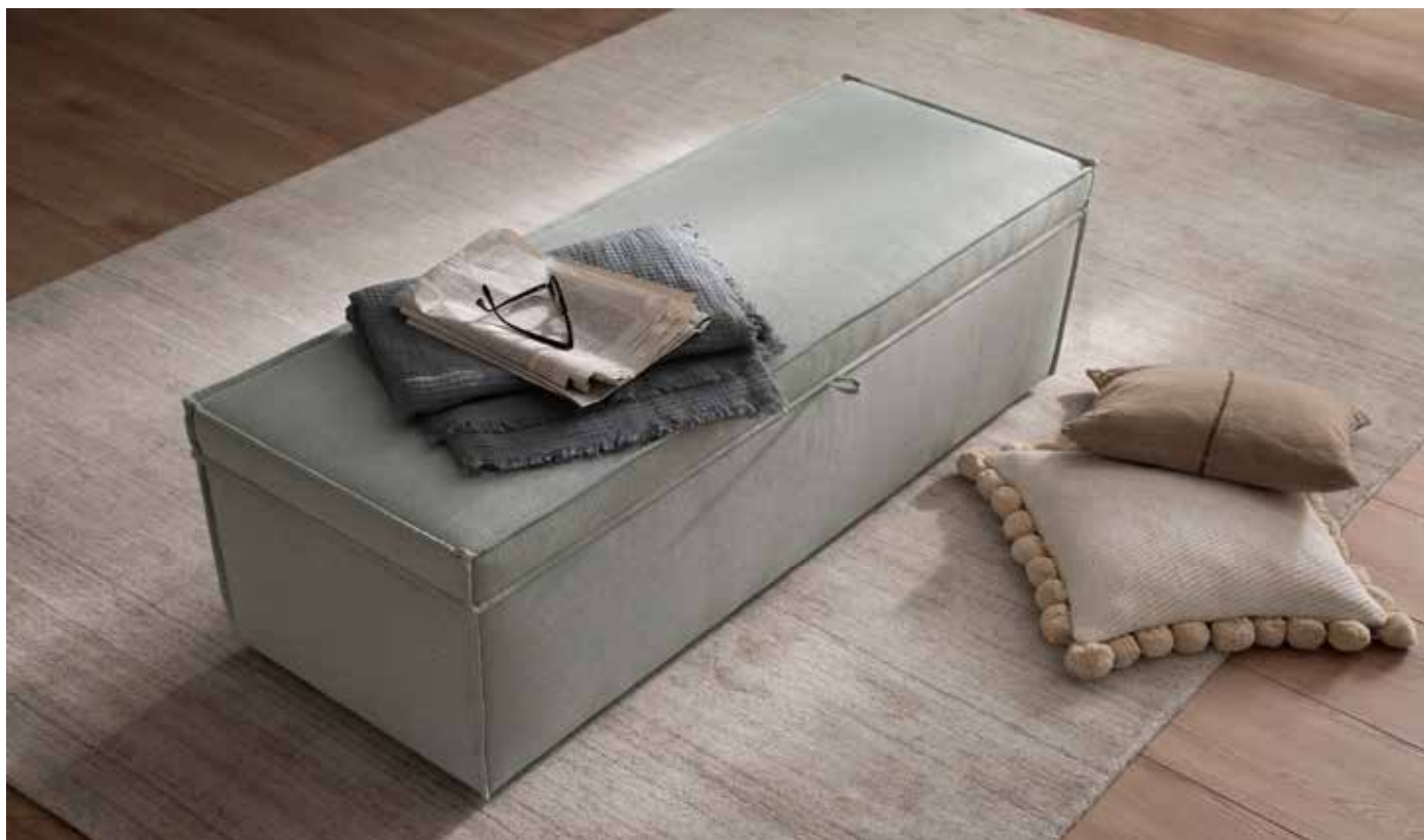
Hockerbank mit Biese