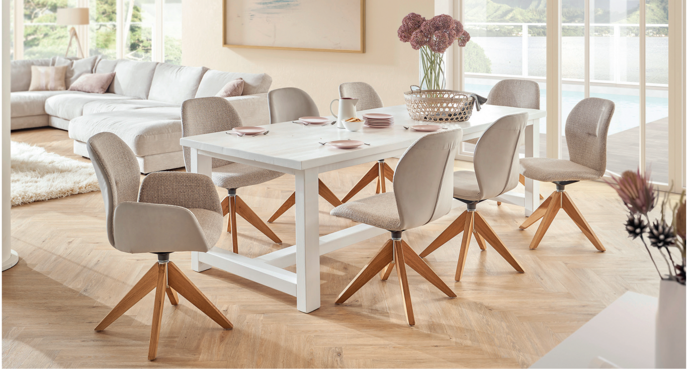
Stühle und Armlehnstuhl