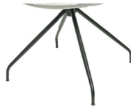
992 Spinnenfuß fest schwarz matt (gegen Aufpreis)