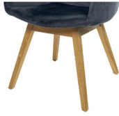
993 Holzgestell Eiche geölt (gegen Aufpreis)