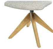
994 Spinnenholzfuß drehbar Eiche geölt (gegen Aufpreis)